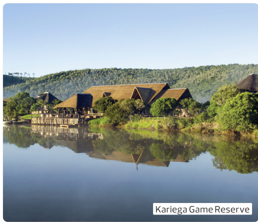
Kariega Game Reserve