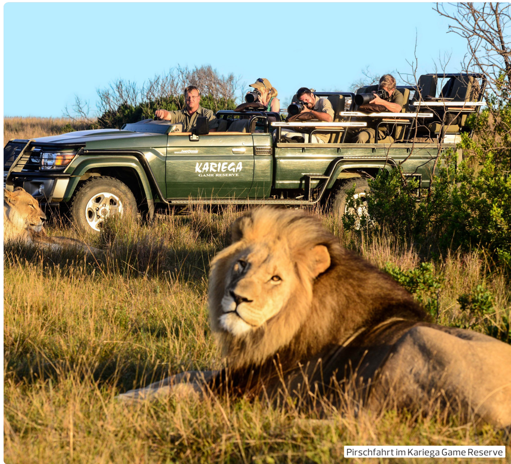
Pirschfahrt im Kariega Game Reserve