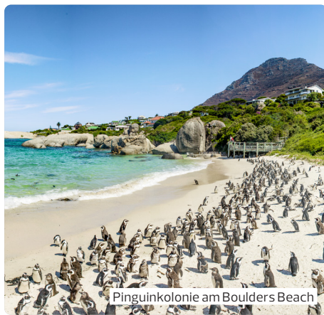
Pinguinkolonie am Boulders Beach