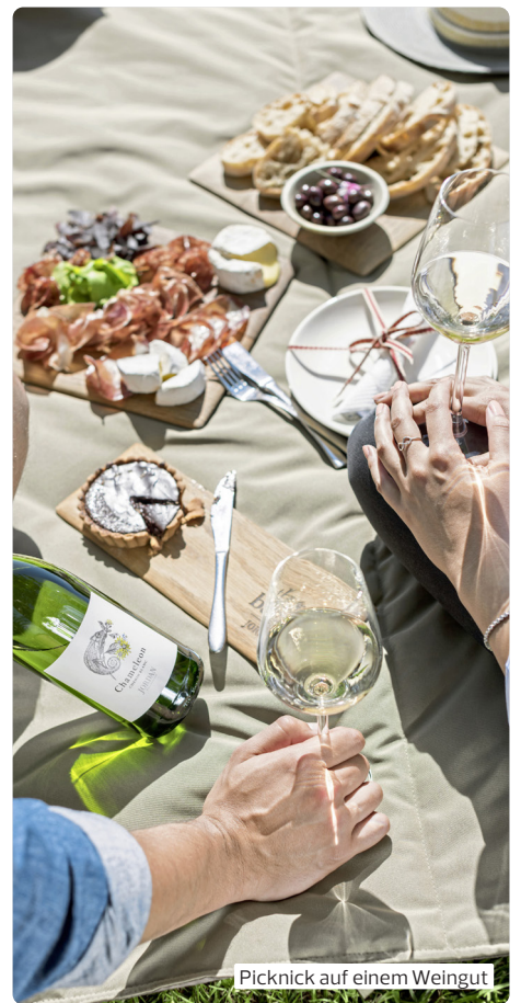
Picknick auf einem Weingut

neys, Käse, Schinken, Brot im Lazy Lizard Padstal. Vorbei an Felsformationen fahren Sie zurück nach Oudtshoorn. (F, M, A)