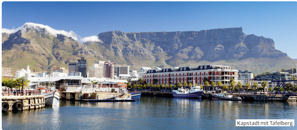
Kapstadt mit Tafelberg